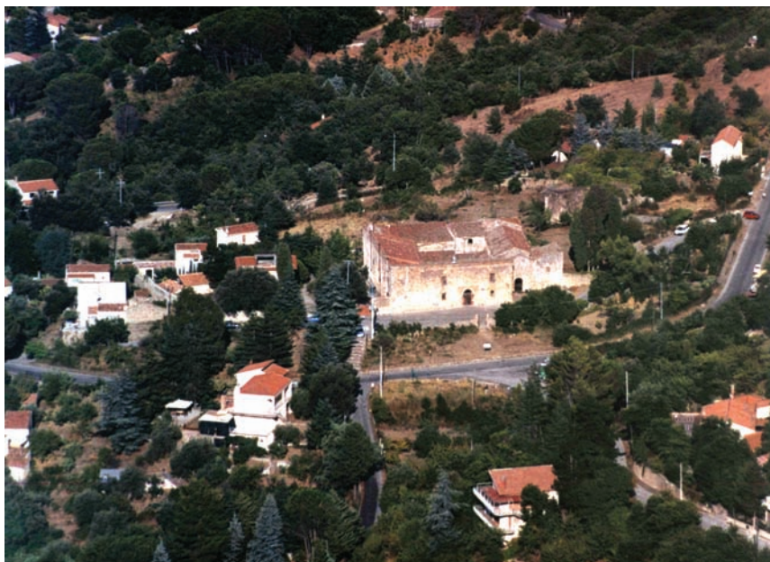
Fig. 5 - Abbazia di Santa Maria del Parto.

valente del territorio, non c'è addirittura traccia 95 . L'incolto insomma vi dominava incontrastato e il bosco, che a ovest si fermava al casale di Vinzeria, dalla parte di sud-est si spingeva certamente fino a lambire le case del borgo.