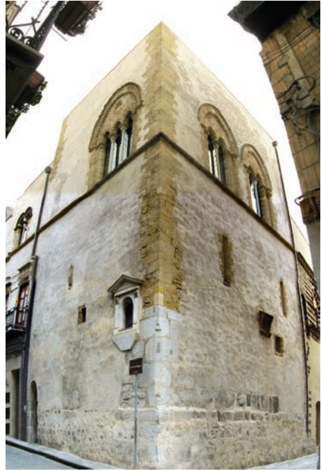
Fig. 4 - Osterio Magno, Cefalù.

All'origine della costruzione del castello non c'era quindi la necessità di una nuova dimora. Più verosimilmente la motivazione della sua erezione deve indi-