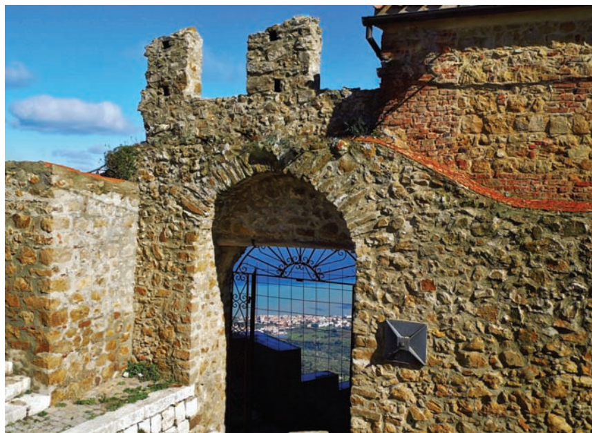
Fig. 7 - Castello di Pollina, particolare.

Il conte Francesco si impegnò notevolmente per il rafforzamento territoriale del suo stato feudale con una politica di scambi e di accorpamenti in parte anche a danno del vescovato di Cefalù, costretto nel 1321 a cedergli il castello di Pollina (Fig. 7) insieme con il territorio e i vassalli, in cambio dei due casali Femminino e Veneruso. La permuta fu ufficialmente motivata con il fatto che Pollina forniva alla chiesa un reddito di 30-40 onze l'anno, appena sufficiente a coprire le spese di custodia e di riparazione delle mura del castello, e fu presentata come un atto a favore della chiesa: il vescovo Giacomo da Narni e il suo capitolo infatti dovettero pregare ripetutamente il conte, recalcitrante, perché addivenisse a una permuta con qualche suo stabile che fosse di maggior utile per la chiesa. Finalmente Francesco acconsentì e concesse i casali di Femminino e Veneruso – disabitati e periferici rispetto alla contea, ma redditizi perché rendevano in media 60 onze l'anno