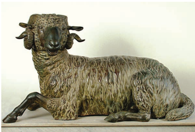
Fig. 13 - Uno degli arieti di bronzo donato a Giovanni I (Museo Salinas, Palermo).

circa venti dei più importanti organizzatori della congiura e segretamente, nella stessa roccaforte, fece tagliare loro le teste. Tolti di mezzo questi uomini, la rivolta fu subito domata in tutta la città. Conclusa questa impresa, presentatosi con l'insperata bella notizia a Lopez, ancora in trepidazione per la difficoltà di poter condurre a compimento l'operazione, ricevette da lui come premio per così utile ufficio i due arieti... [di bronzo dei primi decenni del III secolo a. C., attribuiti alla scuola di Lisippo, Fig. 13] e li trasportò nella cittadina di Castelbuono, che era sua e nella quale aveva anche la sua famiglia 143 .