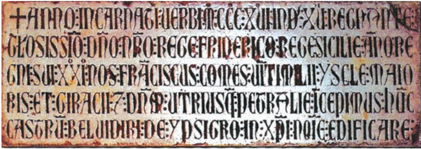
Fig. 1 - Avvio dei lavori di costruzione del castello di Ypsigro nel 1317.

entro i limiti della Terravecchia. Per Magnano di San Lio, «la posizione del castello è di quelle che consentono una difesa da nemici esterni ma anche dalla popolazione del borgo, dislocazione che è diffusissima nei castelli feudali di nuova fondazione» 88 . La tradizione ne attribuisce