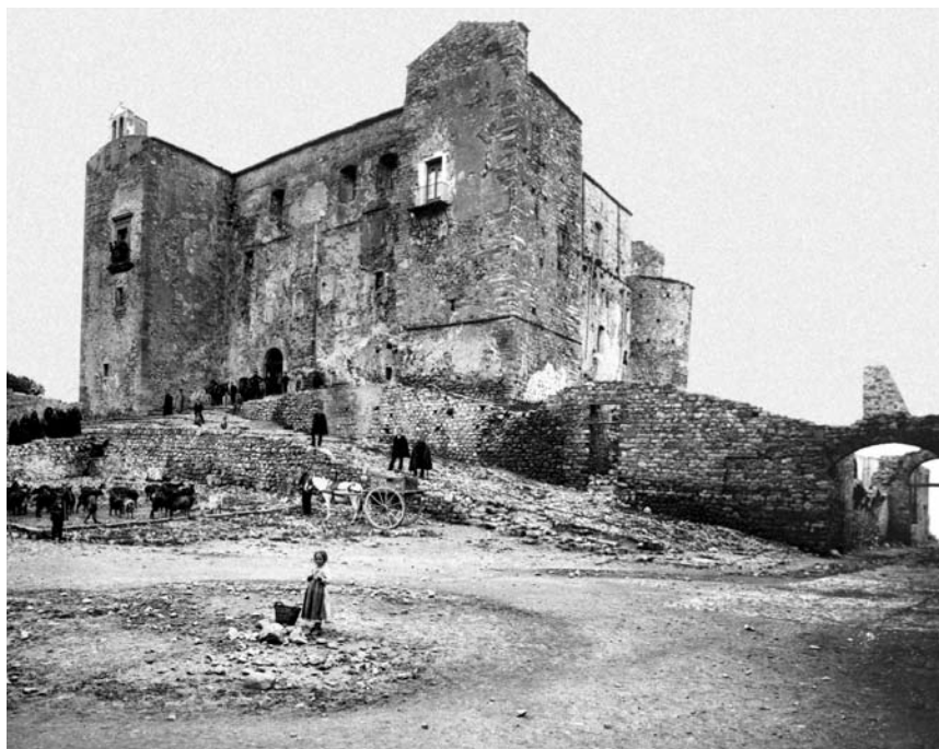
Fig. 6 - Castello di Castelbuono.

di Castelbuono ( Castrum bonum , Castello bono ), come nel corso del terzo decennio del Trecento cominciò a essere nominato il vecchio casale di Ypsigro. Ai nuovi abitanti il signore dovette concedere agevolazioni e aiuti per la costruzione di case e la messa a coltura dei campi, oltre alla possibilità – forse già sin d'allora – di innestare gli oleastri che crescevano spontaneamente nei suoi feudi e di appropriarsene, a patto che si obbligassero al rispetto del diritto dei nozzoli , cioè al monopolio dei suoi trappeti, dove le olive venivano sottoposte soltanto a una leggera spremitura, che lasciava buona parte del prodotto a disposizione del feudatario. Aveva così origine la proprietà promiscua, presente ancor oggi nelle campagne dell'antico 'stato' di Geraci – in cui talora suolo e ulivi appartengono a due diversi proprietari – e anche nei vicini territori di altri comuni.