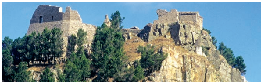
Fig. 2 - Castello di Geraci.