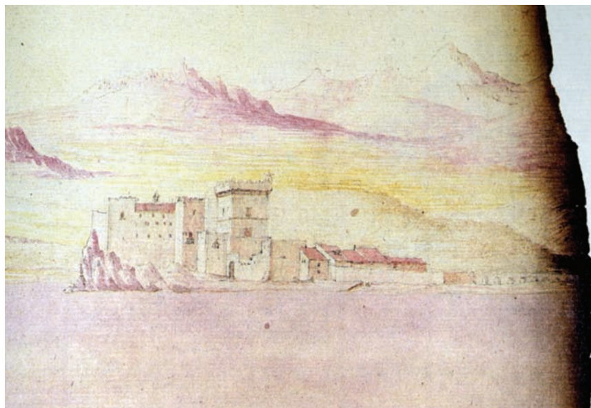
Fig. 10 - Castello di Roccella (M. Scarlata, L'opera di Camillo Camilliani , Roma, 1993).

nel 1385 ottenne in permuta Roccella (Fig. 10) e un palazzo a Polizzi dal vescovo di Cefalù, al quale cedette in cambio il suo feudo Alberi, in territorio di Petralia Sottana 51 . Due acquisizioni importanti, perché Isnello significava non solo togliersi la spina dal fianco costituita dall'irrequieto Abbate, ma anche compattare ulteriormente il complesso feudale perché il suo possesso assicurava la continuità territoriale fra la contea di Geraci e quella di Collesano; mentre Roccella significava non solo l'ulteriore espansione fino al mare della contea di Collesano, e quindi il possesso di un secondo scalo marittimo in alternativa a quello di Tusa, ma anche un migliore collegamento con Termini e un più ferreo controllo della città demaniale di Cefalù e del suo territorio, dove egli abitava e aveva forti interessi.