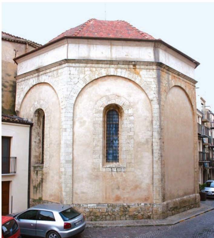
Fig. 16 - Cappella (cappellone) di Sant'Antonio, Castelbuono.

dono spesso solo al bisogno di primeggiare rispetto alle altre famiglie del gruppo aristocratico» 260 .