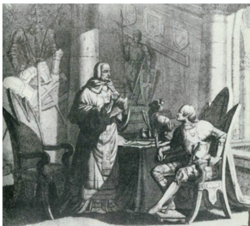
Fig. 8 - Il vescovo Campolo rimbrota Francesco I, 1337 (Collezione del principe di Belmonte).

(«minister et consultor tocius sceleris», lo avrebbe poi definito re Pietro). Francesco confidava nell'appoggio dei vassalli di Geraci, ma l'infelice conte – scrive Michele da Piazza – non era riuscito a conoscere, lui che si dedicava agli auspici e alle divinazioni, l'etimologia di Geraci ( Giracium ), che nient'altro significa che girare; chi gira è mobile e, poiché il nome è consono alla cosa, al fatto (per i latini nomina sunt consequentia rerum ), i suoi abitanti, i geracesi, sono volubili per nascita e non sono capaci di fermi propositi 125 .