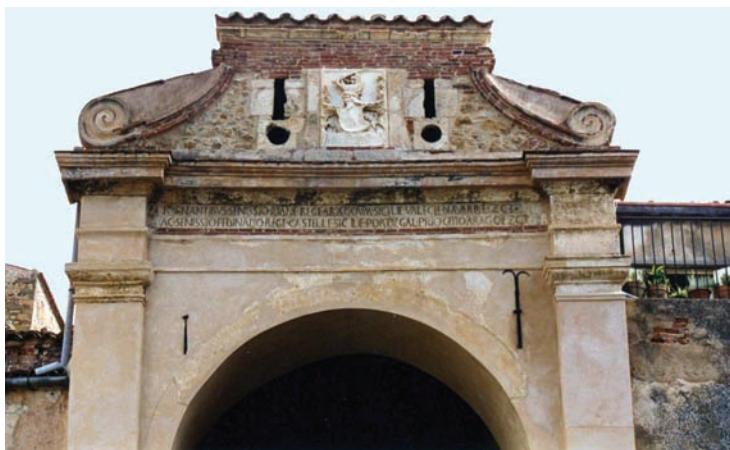
Fig. 15 - Arco di chiusura del cortile perimetrale del castello, con lo stemma del marchese Antonio.

Con il figlio e successore di Giovanni, il marchese Antonio, fu sistemato il piano del castello sulla attuale via Sant'Anna e nel 1477 fu completata la chiusura perimetrale del cortile esterno, che ancora nella prima metà del Novecento i castelbuonesi chiamavano 'u chianu 'a baddra ossia il piano della palla , perché i signori feudali vi praticavano il gioco della palla. Sul frontespizio dell'arco che dà sulla via Sant'Anna (Fig. 15), proprio sotto lo stemma dei Ventimiglia, si legge infatti – quasi come se facesse parte integrante proprio dello stemma, il simbolo del potere di più immediata riconoscibilità – ANT(ONI)US (a) MA(R)KIO ET A(M)MIRATUS (a) , e sotto ancora M°CCCCLXXVII, mentre, fra la data e l'arco, è riportata la seguente iscrizione su due righe: REGNANTIBUS SE(RE)NISSI(M)O IOA(N)NE REGE ARAGO(N)UM SICILIE VALE(N)CIE NAVARRE ET (b) CETERA (c) / AC SE(RE)NISSI(M)O FE(R)DINA(N)DO REGE CASTELLE SICILIE PORTUGAL(LI) PRI(M)O GE(N)ITO ARAGO(N)IE ET (b) CETERA (c) 244 .