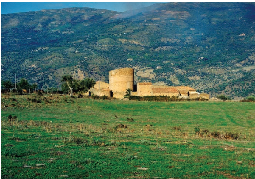
Fig. 14 - Torre di Migaido, con a destra la cappella di Sant'Antonino.