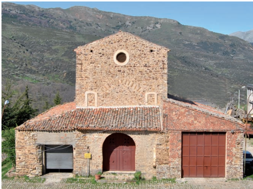
Fig. 9 - Chiesa di San Bartolomeo, Geraci.

E come se non bastassero gli atti di cannibalismo, il vile Valguarnera – concludeva commosso il cronista Michele da Piazza – perduto ogni pudore trascinò legato alla coda di un cavallo ciò che restava del nobilissimo conte Ventimiglia, che egli non aveva né vinto in battaglia né catturato da vivo: un atto crudele e ignobile. E d'altra parte era impossibile attendersi atti di compassione da uno come Valguarnera, «perché nessuno può dare ad altri ciò che non ha». Pietoso, Ruggero Passaneto raccolse infine i resti e li tumulò nella chiesa di San Bartolomeo, fuori le mura di Geraci (Fig. 9). Era l'1 febbraio 1338 129 . I beni dei Ventimiglia, confiscati, furono divisi fra i vincitori: la contea di Geraci alla regina Elisabetta